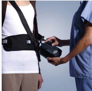
Prozedurvorbereitung durch Assistenzpersonal