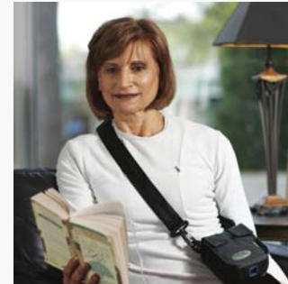
Patient kann während Prozedur seinen normalen Alltagsaktivitäten nachgehen