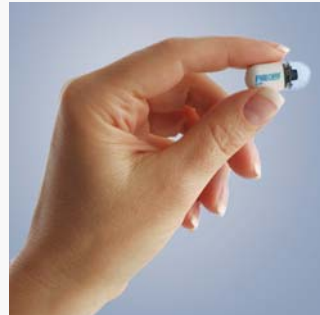
Patient schluckt Kapsel