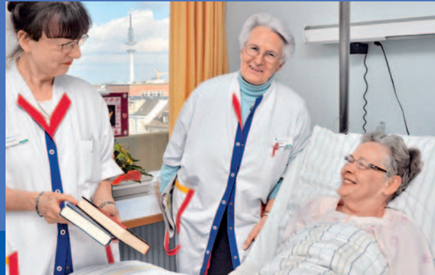
Die Grünen Damen und Herren des ENDO-Vereins leisten einen wichtigen Beitrag zur Versorgung der Patienten im Anschluss an eine Gelenkoperation.

von Forschung auf dem Gebiet der Bewegungsorgane – mit dem Themenschwerpunkt rund um die Endoprothetik – verschrieben. Im Jahr 2002 hat der ENDO-Verein die ENDO-Stiftung gegründet, die er seither fördert. Mit Hilfe der Fördermittel des Vereins unterstützt die ENDO-Stiftung zahlreiche nationale und internationale wissenschaftliche Projekte , deren Ergebnisse in renommierten Fachzeitschriften veröffentlicht werden.